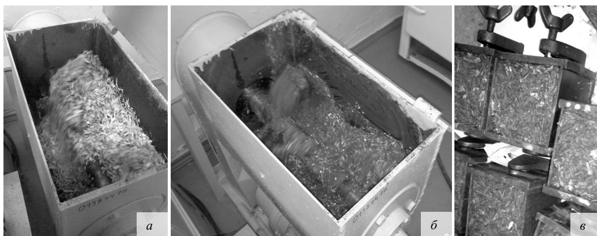
а – осмоление стружки жидким стеклом; б – смешивание раствора арболита; в – формование образцов в разъемных формах

В отдельной емкости приготовили раствор гидрофобизатора и воды, а затем последовательно вливали его в работающий смеситель с предварительно подготовленной древесно-цементной смесью (рис. 1, б) на основе портландцемента марки 500 Д0 (без добавок).