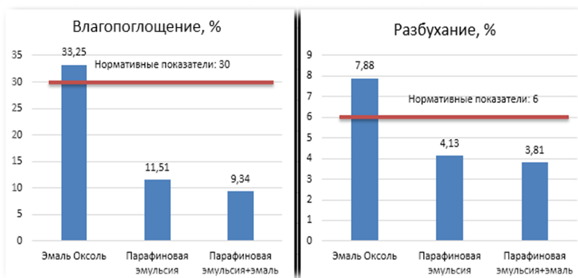
Рис. 2. Результат исследований влияния различных лакокрасочных материалов на величину влагопоглощения и разбухания

Область варьирования количества вводимой парафиновой эмульсии составила от 10 до 50 %. Введение парафиновой эмульсии от 10 до 40 % не давало ощутимых результатов по влагопоглощению и разбуханию. Введение более 50 % приводило к тому, что увеличивалось время сушки лакокрасочной композиции. Отверждение было достигнуто при смешивании парафиновой эмульсии и эмали в соотношении 50/50 %. Результаты экспериментальных исследований представлены на рис. 2.