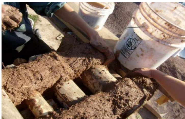
Рис. 2. Ленточный способ укладки раствора

По конструкции несущих стен строительные сооружения из глиночурки могут быть опорные и безопорные. В опорном способе используется брус или плотная кладка мелкого бруса на углах дома для увеличения жесткости конструкции (рис. 3) [3].