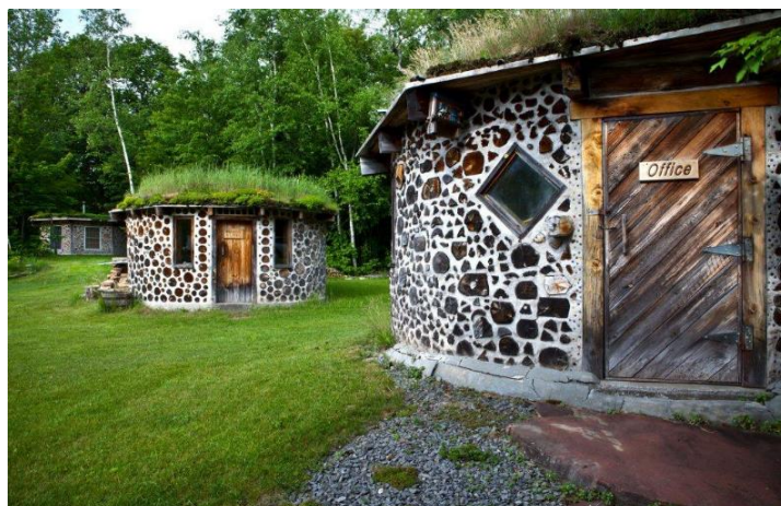
Рис. 4. Конструкция круглой формы

В качестве расчета объема поленницы из древесной чурки можно использовать значение коэффициента полндревесности из ГОСТ 3243–88 [5].